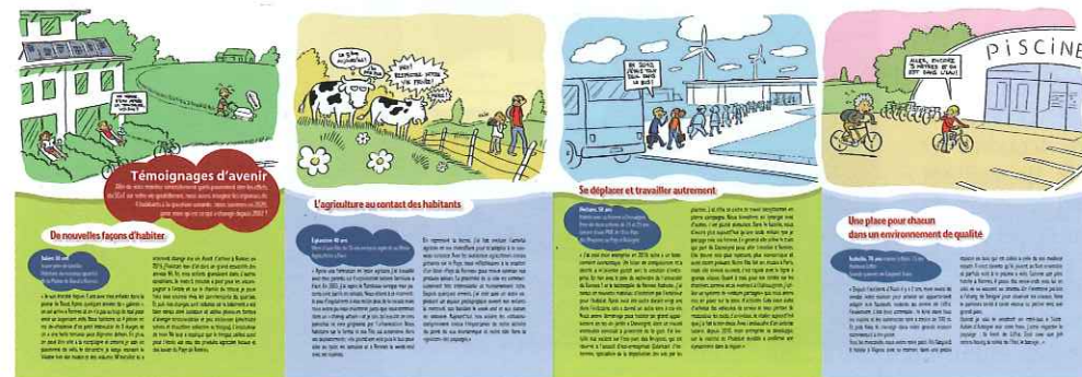
> 4 pages intérieures du dépliant

Cette étape de concertation, réglementaire, s'inscrit dans une forte démarche de concertation souhaitée par les élus du Pays de Rennes. Ils ont souhaité associer, au-delà même des exigences réglementaires, les habitants, les associations et toutes les personnes concernées, qu'il s'agisse des représentants de la profession agricole ou de la société civile, regroupés au Codespar, Conseil de développement du Pays de Rennes. L'objectif était bien de favoriser l'expression des attentes et des aspirations des habitants, de les sensibiliser aux enjeux du futur. Pour un enjeu essentiel : l'appropriation du Scot du Pays de Rennes par tous.