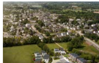
Maisons Coop de construction