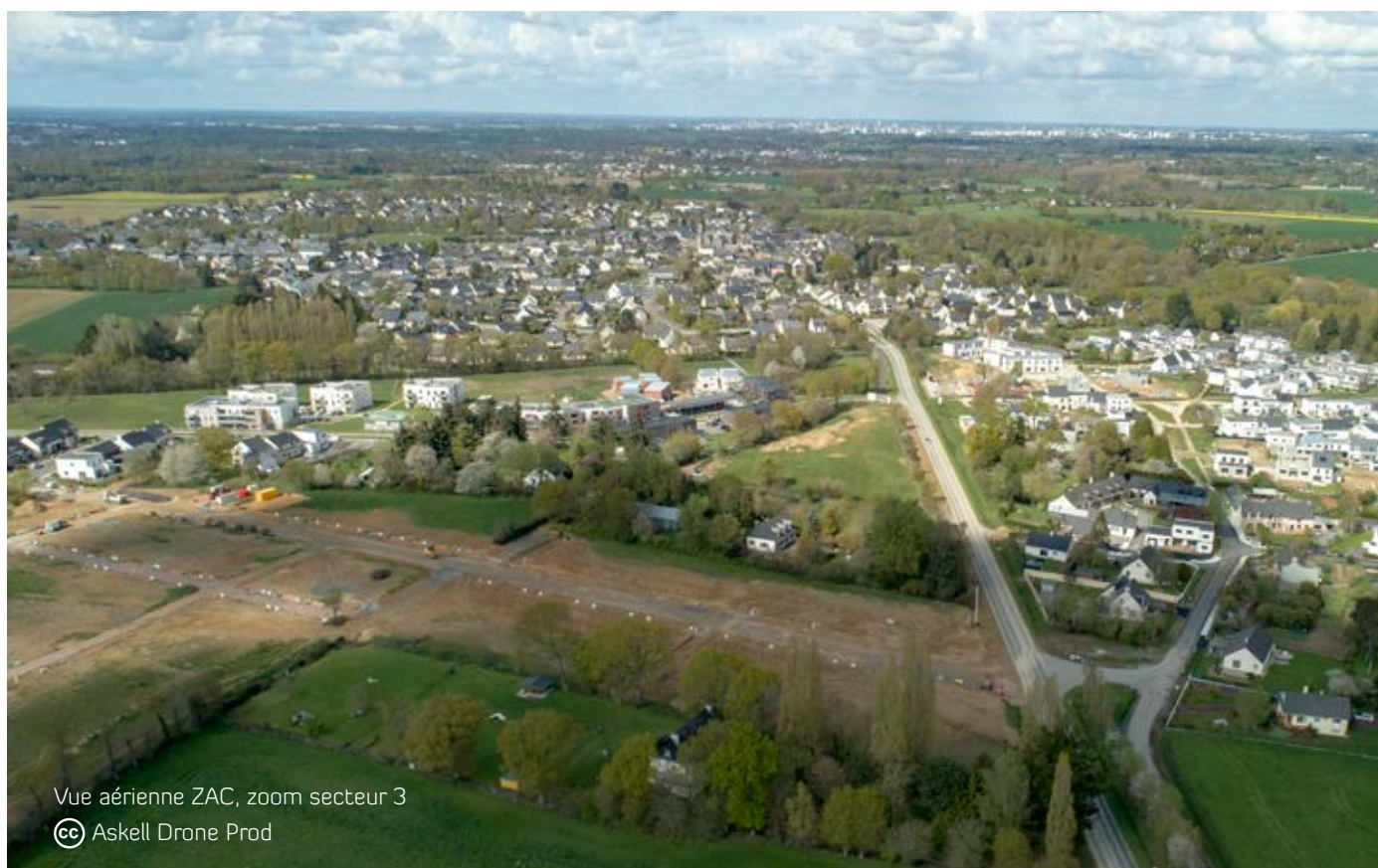
Vue aérienne ZAC, zoom secteur 3

La création de ce giratoire est prévue à l'été 2019, ce qui entrainera quelques perturbations de circulation pendant le mois de juillet 2019.