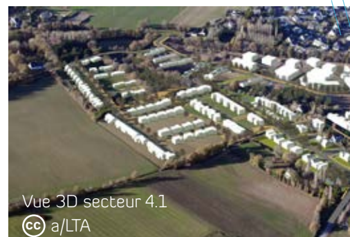
Vue 3D secteur 4.1

L'engagement de la partie habitat du secteur 4.1, à la lisière avec la Lande de Montenay interviendra à partir de fin 2019/début 2020 en fonction de l'avancement de la commercialisation du secteur 3.