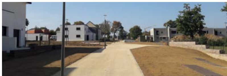
Le Mail, Secteur 2

Les travaux de finitions sur la rue de la croix faucheur, les rue Fol n'a Dieu et Leon Ladulfi seront engagés à compter du printemps 2019 pour s'achever d'ici fin 2019 selon les conditions météorologiques.