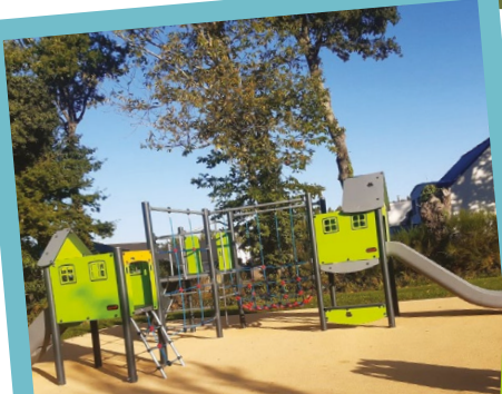
AIRE DE JEUX : DU NOUVEAU POUR LES ENFANTS