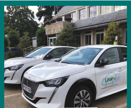
LE SERVICE AUTOPARTAGE LOUE'ISE