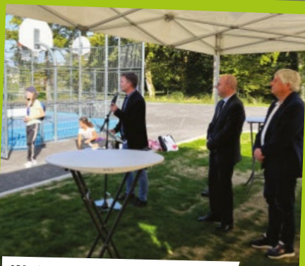
INAUGURATION DU CITY STADE