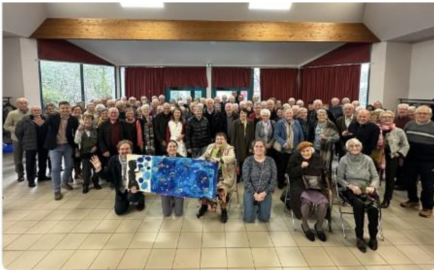
Repas CCAS 26 novembre 2023